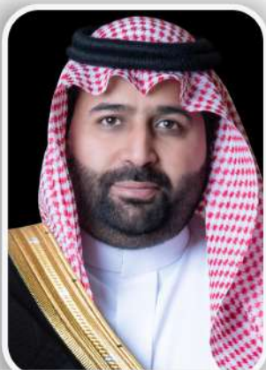
نائب أمير منطقة جازان : محمد بن عبدالعزيز آل سعود