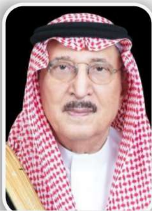
أمير منطقة جازان : محمد بن ناصر آل سعود